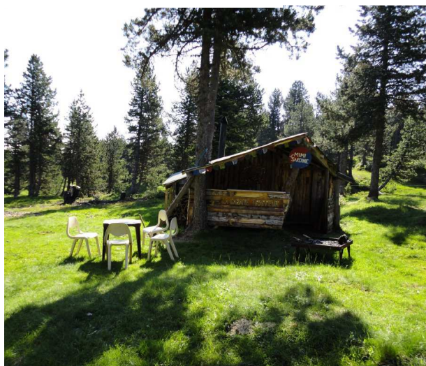
cabane trappeur d'ANGAKA

Angaka Village Nordique, Plateau de Beille, 09310 Les Cabannes